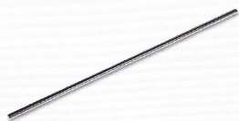
Asta filettata in acciaio 10x500 mm