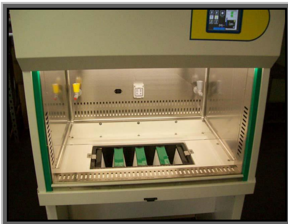
Terzo filtro hepa posto sotto il piano di lavoro