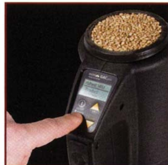
4 Premere e leggere

IL Mini GAC® Plus è semplicissimo da utilizzare. Dopo l'accensione è sufficiente seguire le indicazioni del display, scegliere il prodotto da analizzare, riempire la tramoggia, caricare la cella e premere il pulsante di analisi. Il risultato sarà visualizzato in pochi secondi.