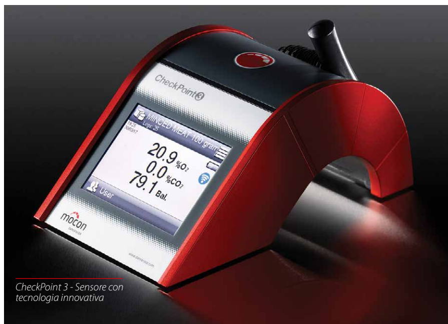
CheckPoint 3 - Sensore con tecnologia innovativa