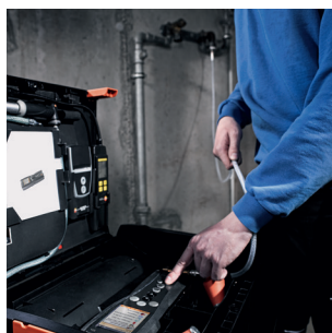
Controllo automatico della tenuta