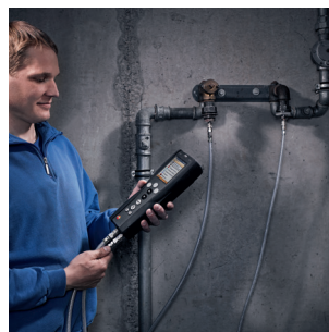
Prova di idoneità all'uso