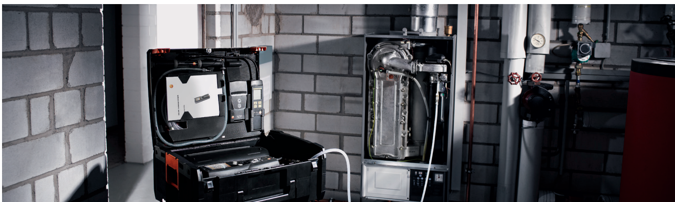
Controllo automatico della capacità operativa con serbatoio di riempimento gas collegato alla caldaia a gas