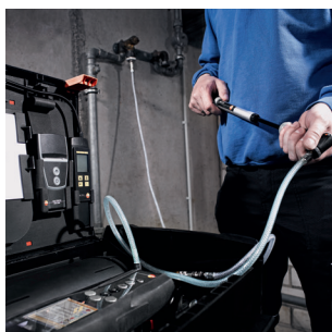
Prova di carico

* Strumento, pompa, tubetti di connessione, con valvola per sovrappressione e rubinetto d'arresto