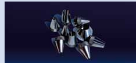
UGELLI CONICI in acciaio o titanio (diametri compresi tra 3 e 16 mm)

SONDA IN TITANIO riscaldata per il campionamento di microinquinanti. I componenti della sonda a contatto con gli inquinanti sono realizzati totalmente in Titanio e come previsto dalla norma EN 1948 , la misura della temperatura di campionamento avviene all'interno della camera di campionamento a valle del setto filtrante. Sono disponibili sonde di lunghezza differente: 50 - 100 - 150 - 200 cm