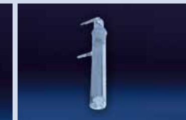
GORGOGLIATORE TIPO A per prelievi di gas inorganici in emissione secondo i metodi Unichim e DPCM del 28/3/83