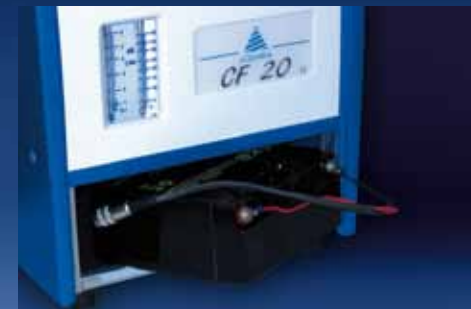
Batteria al piombo ricaricabile

Lo strumento viene fornito, oltre che con l'innovativo trolley, con una pratica maniglia di trasporto in tela plastificata rimovibile.