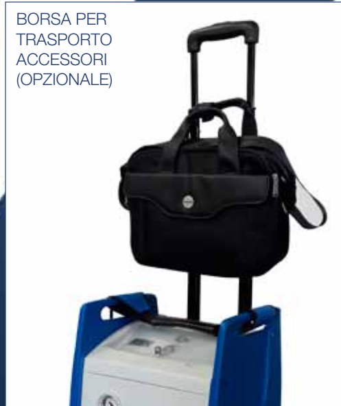
BORSA PER TRASPORTO ACCESSORI (OPZIONALE)