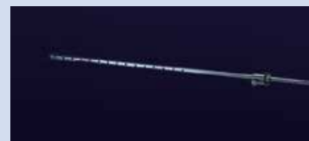
SONDA DI PRELIEVO GAS MULTIFORO a norme Unichim. Costruita in acciaio AISI 316. Completa di portagomma per il collegamento pneumatico e di attacco filettato per l'inserimento nelle flange delle sonde isocinetiche. E' disponibile con lunghezza 1 o 2 metri.