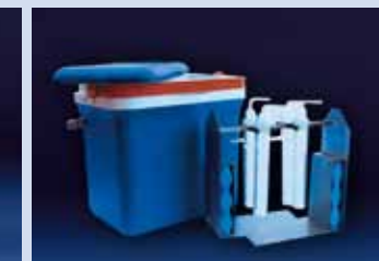
VALIGIA TERMICA completa di cestello portagorgogliatori in acciaio inox AISI 316 a 4 posti. Questa soluzione permette di mantenere i reattivi contenuti nei gorgogliatori a bassa temperatura prolungandone così nel tempo l'efficienza. Il raffreddamento può essere fatto tramite panetti per ghiacciaia.