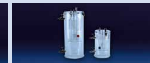
IL CONDENSATORE IN VETRO ad alta efficienza è un dispositivo realizzato per ottenere il massimo raffreddamento dei fumi aspirati congiuntamente ad una raccolta efficace della condensa di risulta. Sono disponibili condensatori da 2 litri e da 1 litro.