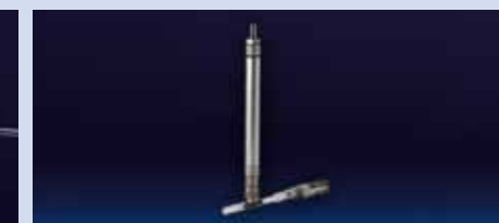
PORTAFIALA IN ALLUMINIO adatto a contenere fiale Large e Jumbo. Utilizzabile sulla linea di prelievo. Completo di portagomma per collegamento al tubo di prelievo.