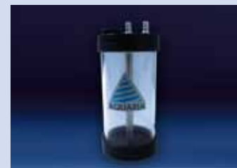
IL CILINDRO DEUMIDIFICATORE è costituito da una comoda e solida cartuccia in plexiglass caricabile con del comune gel di silice con viraggio di colore o con del carbone attivo, adatta a trattenere le eventuali condense il cui contenuto potrebbe essere corrosivo e quindi danneggiare la pompa in caso di accidentale aspirazione. Dimensioni: diam. 9 cm x 23 cm altezza