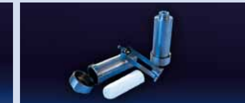
PORTADITALE per ditali in fibra di vetro (30 x 100) PORTADITALE per ditali in ceramica (25,5 x 80)