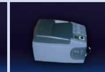
FRIGORIFERO CONGELATORE portatile con regolazione termostatica: tra 1° e 5°C (fino a 30° al di sotto della temperatura ambiente). Internamente è già predisposto per l'alloggiamento dei gorgogliatori necessari per il campionamento.