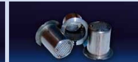
CESTELLO PER LANA DI SILICE in acciaio o titanio