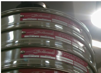
Setacci Certificati in Acciaio Inox