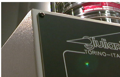
Verinciatura a Triplo Strato antiacido

SETACCIATORE multidimensionale ad alta efficienza rif 'IG/1/S/300' realizzato secondo le normative (salvo modifiche): UNI - ASTM - DIN - DIN - BS - TYLER - GOST -NF con motorizzazione meccanica potenziata, idoneo a portare in setacciatura n. 5 Setacci diam. 300 mm. altezza 65 mm. + fondo raccoglitore e coperchio L'alta silenziosità lo rende il Setacciatore alta capacità ideale per il laboratorio analisi.