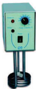
FA 90 E senza pompa