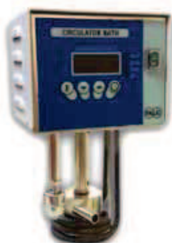
FA 90 con pompa