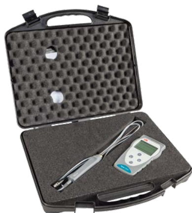
Temp 7 NTC Kit

Il termometro Temp 7 NTC è la scelta ideale per le misure veloci in un campo ristretto di lavoro.