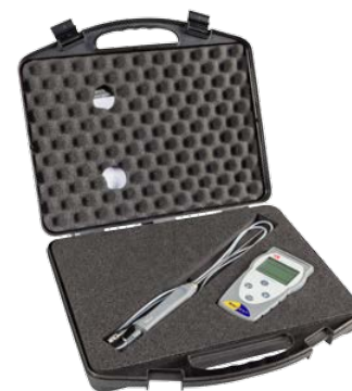
Valigia di trasporto

Il termometro Temp 7 K/T per sonde termocoppia K e T è lo strumento robusto e facile da usare, che grazie al suo ampio display, permette una lettura chiara ed una misura accurata.