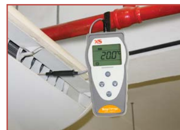
Misura della temperatura in sistemi di condizionamento

Studiati ergonomicamente per una comoda operatività con una sola mano. La superficie nervata assicura una presa sicura prevenendo scivolamenti durante l'uso.