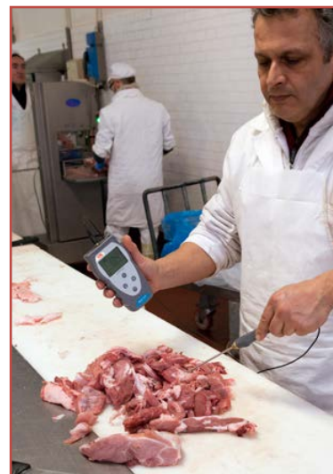
Misure nel settore alimentare

La versione completa di sonda per liquidi ed aria e la comoda valigetta di trasporto viene proposta ad un prezzo economico.