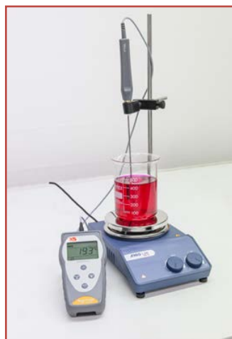
Misura della temperatura di liquidi