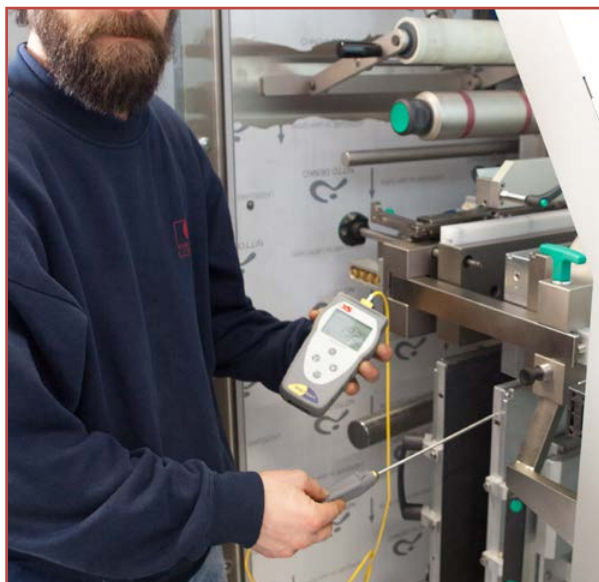
Misure nel settore industriale

L'ingresso predisposto per termocoppie K e T lo rende molto flessibile per applicazioni nel campo industriale e nel campo farmaceutico dove le termocoppie tipo T garantiscono una maggiore precisione della misura.