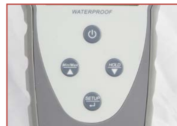
Tastiera a prova di schizzi