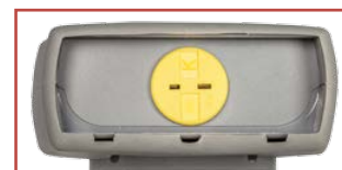
Ingresso sonda termocoppia K e T