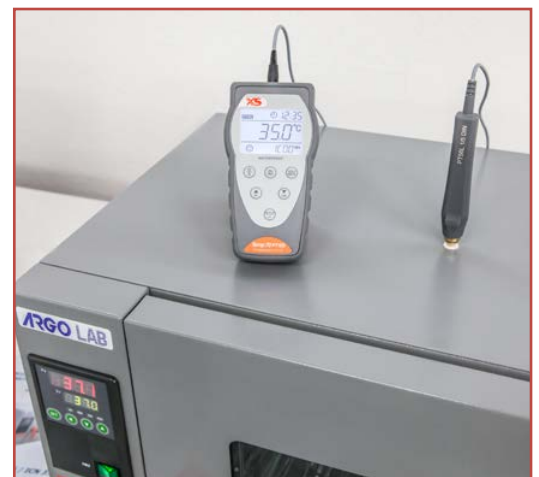
Controllo della temperatura di un incubatore