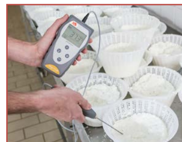
Ottimo per il settore alimentare