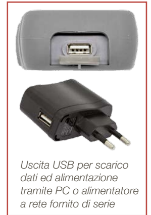
Uscita USB per scarico dati ed alimentazione tramite PC o alimentatore a rete fornito di serie

Se usato in abbinamento con la sonda PT56L 1/5 DIN è ideale come strumento primario