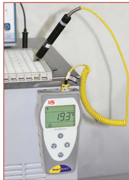
Misure in laboratorio