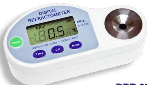
DBR 35 DBR 45 DBR Salt

DBR la serie di rifrattometri a lettura digitale ideale per il laboratorio e la produzione. Semplici da usare, basta una goccia di campione sul prisma di lettura e sul display comparirà la concentrazione, basta con scale ottiche di difficile valutazione. Adatti anche con campioni torbidi o colorati.