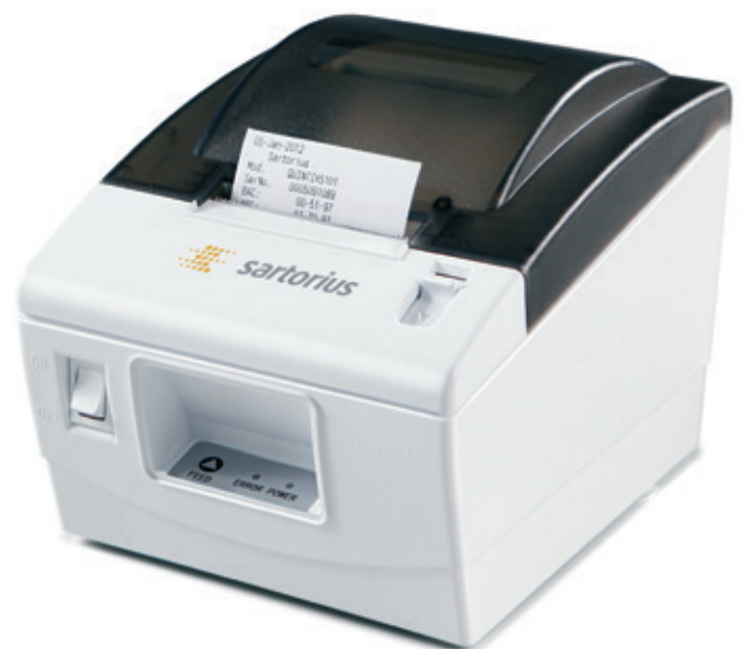
YDP40, stampante da laboratorio standard