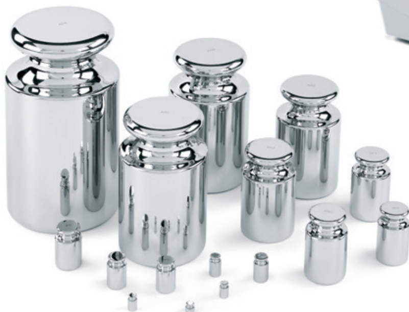
Pesi di calibrazione

- Peso a manopola da 20 g, classe OIML E2, con certificato DAkKS