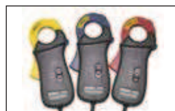
Modello PQ3110 Sonde a pinza per corrente 100 A con apertura ganascia da 30 mm