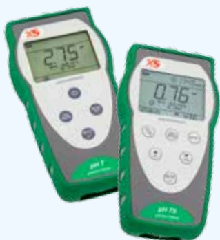
pHmetri pH 7 - pH 70

Una linea completa di strumenti portatili impermeabili e testers per pH, conducibilità e ORP nella misura in campo.