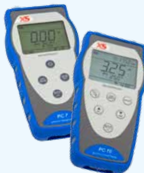
Multiparametri PC 7 - PC 70