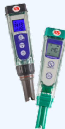
pH-COND-PC-ORP Tester a tenuta stagna