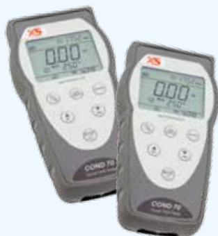
Conduttimetri COND 7 - COND 70