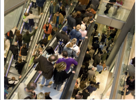
Centri commerciali, palestre