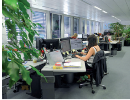
Sale per meeting, uffici open space